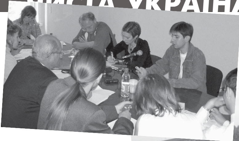
Одна з багатьох прес-конференцій, проведених "Чистою Україною" містами нашої Неньки. Ця в Тернополі...