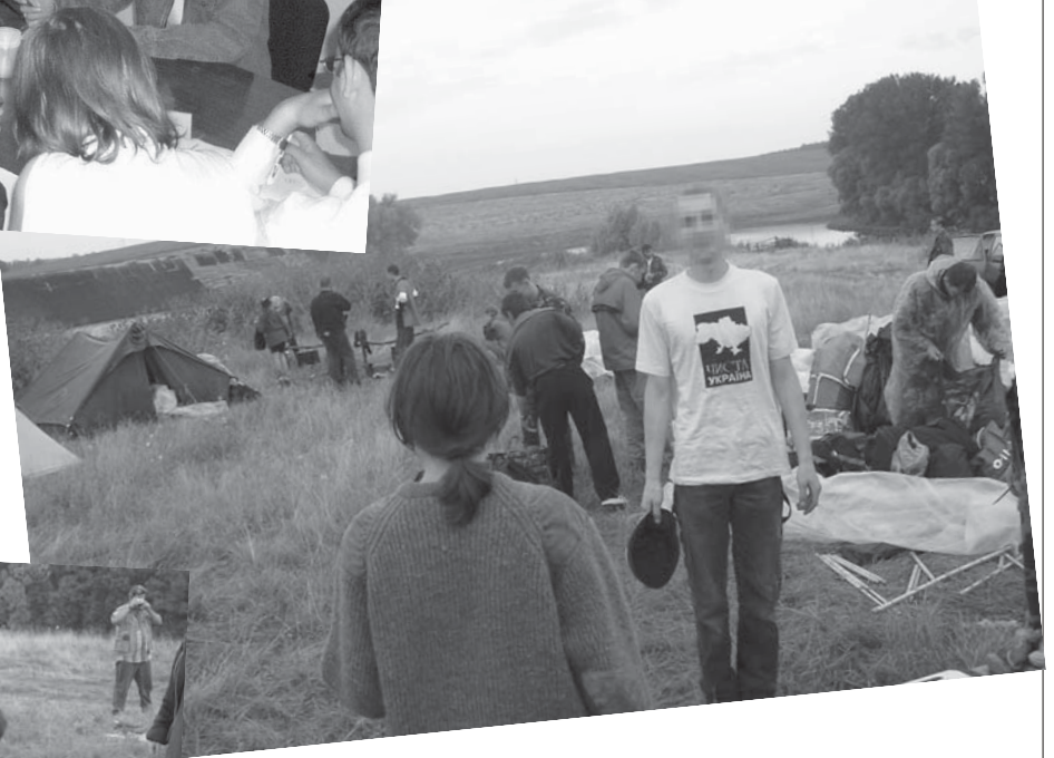
Наш активіст серед сумських таборників...