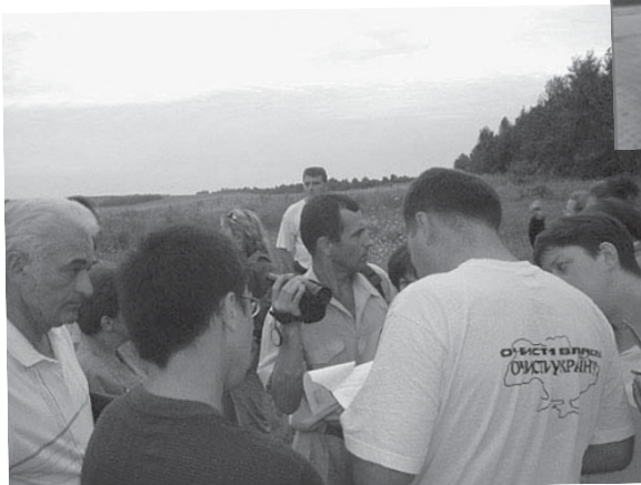
Наш активіст розтлумачує роменській владі та Щербаню про те, що вони не праві. Вони вірять і йдуть, такшо морально вони були вбиті ще задовго до нашого арешту...