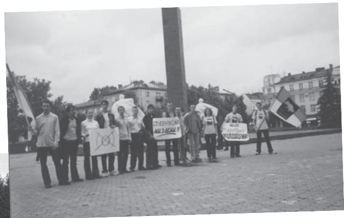
Акція підтримки сумських студентів у Івано-Франківську.