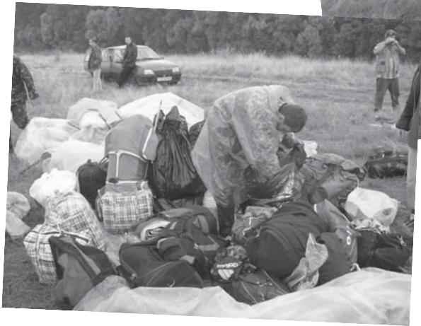
Студентські пожитки в купі. Кожен брав що бачив, і всі були щасливі...